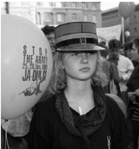
1992: GSoA-Demonstrantin mit Hauptmann-Hut.

Beim WK-Aufgebot im Frühling 1992 war mir klar: Noch einmal würde ich nicht in Uniform anreisen. Die Lösung lieferte Brigadier Raphaël Barras, Oberauditor (Generalstaatsanwalt). Die «Barras-Reform» schaffte einen Ersatz-Arbeitsdienst mit verlängerter Dauer. Die geplante Entkriminalisierung gelang nur ansatzweise. Militärgerichte fällten die Urteile zum Arbeitsdienst und bei nicht bestandener Gewissensprüfung verhängten sie nach wie vor Gefängnisstrafen. Behördlich-