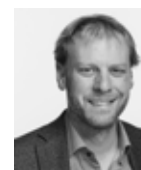
Fabien Fivaz , Nationalrat Grüne.

«Meine Einsätze im Zivildienst haben es mir ermöglicht, meine Fähigkeiten für sinnvolle Aufgaben einzusetzen. Ich habe dabei ausserordentlich motivierte und kompetente Menschen getroffen. Ich habe viel gelernt – sowohl persönlich als auch beruflich.»