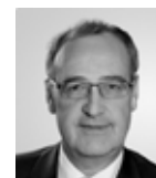
Guy Parmelin , Bundespräsident, SVP-Bundesrat (WBF).

«Derzeit leisten rund 20'000 Zivis Einsätze in knapp 4800 Einsatzbetrieben in der ganzen Schweiz. Sie erbringen damit dort einen Beitrag für die Gemeinschaft, wo für wichtige Aufgaben ansonsten Ressourcen fehlen oder nicht ausreichen.»