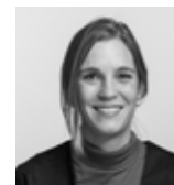
Corina Gredig, Nationalrätin GLP

«Der Zivildienst spielt eine wichtige Rolle in der Schweizer Gesellschaft: Jedes Jahr werden von Zivildienstleistenden über eine Million Dienstage im Sozial-, Gesundheitswesen und im Umweltschutzbereich geleistet. Damit wird ein wichtiger Beitrag geleistet für das Funktionieren unseres Landes.»