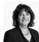
Anna Giacometti, Nationalrätin FDP

«Ich gratuliere herzlich zum 25-jährigen Geburtstag und bedanke mich bei allen Zivildienstleistenden für ihren wertvollen Einsatz zu Gunsten unserer Gesellschaft. Buon compleanno! »