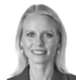
Lilian Studer, Nationalrätin EVP

«Der Zivildienst ist eine Bereicherung für die Gesellschaft wie auch für die Person, die diesen wählt. Zivildienstleistende nehmen Einsätze u. a. im Gesundheits- und Sozialwesen oder im Umwelt- und Naturschutz wahr. Einsätze, die für den Arbeitsbereich und eben für die gesamte Gesellschaft eine Bereicherung sind, dort, wo Unterstützung benötigt wird und der Zusammenhalt unserer Gesellschaft gestärkt wird. Zudem machen die Zivis wichtige und bereichernde Lebenserfahrungen.»